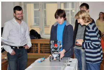
Start vítězného robota týmu JGN1