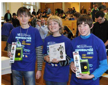
Vítězný tým JGN1