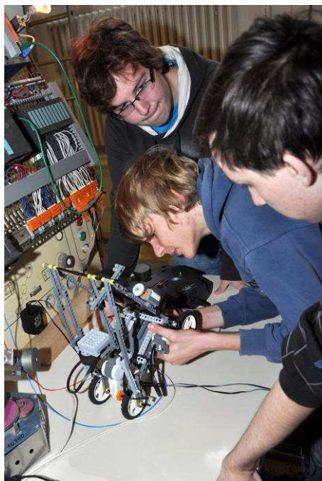
Poslední úpravy robota týmu JGN2